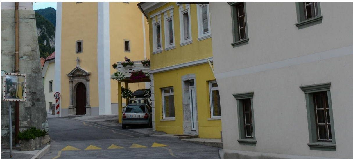
Begunje - med cerkvijo in bolnišnico