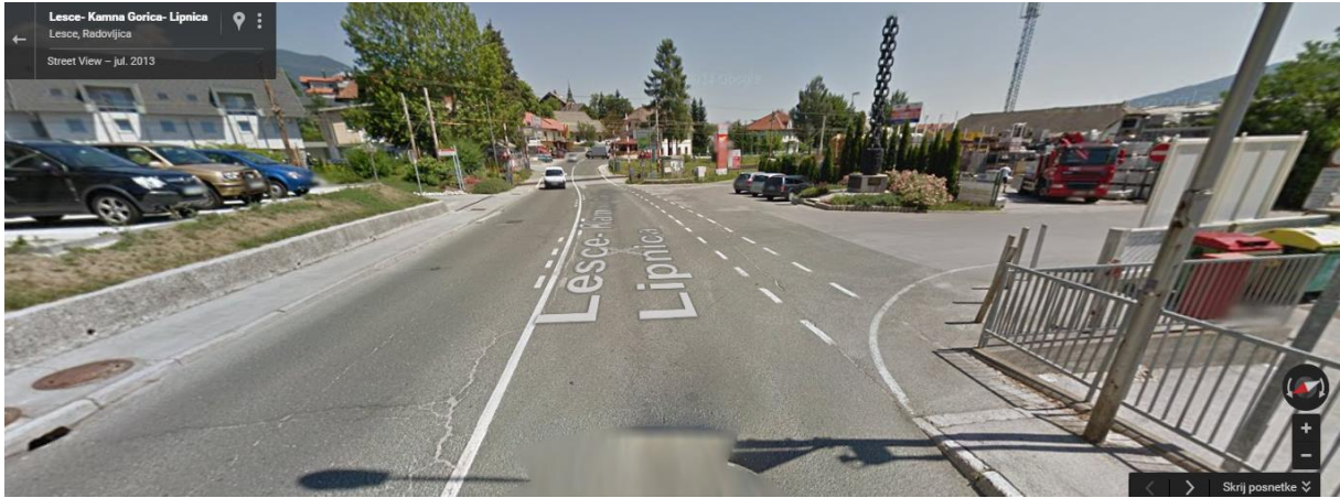
Alpska cesta pred železniškimi zapornicami