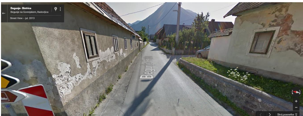
Begunje – zgornji del vasi, pri križišču za Krpin