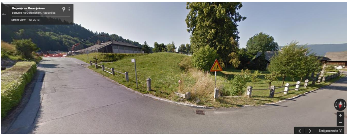
Begunje – križišče pod šolo