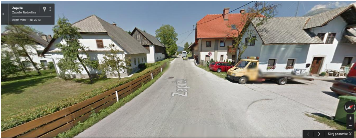
Zapuže – proti avtobusni postaji