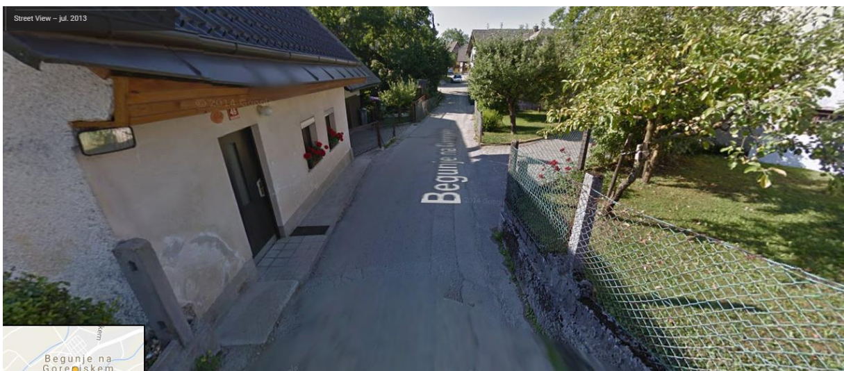
Begunje – od cerkve proti šoli