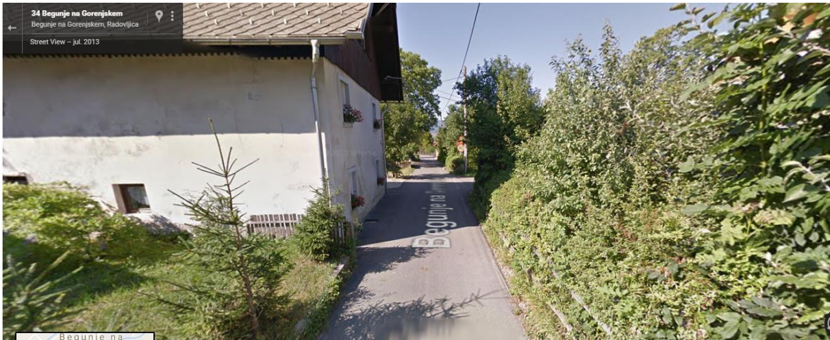
Begunje – od cerkve proti šoli